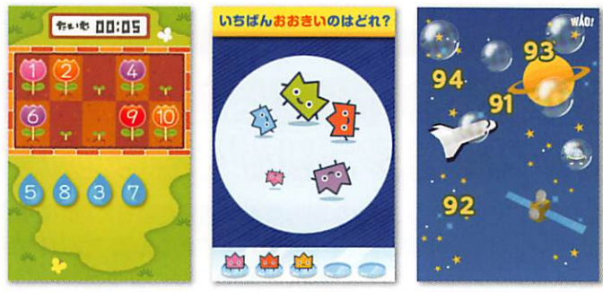
「すずじばん」 「くらべてみよう」 「しゃぼんだまいくつ?」

親子で楽しく学べる知育ゲームが満載のアプリです。幼児期に必要な力をバランスよく育みます。お子さまと一緒に「こうするのかな?」と声をかけながら楽しく学んでください。