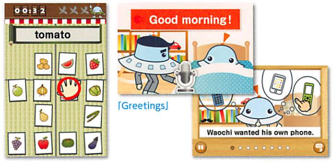
「えいごdeかるた」 「Greetings」 「Picture Book」

英語の挨拶や日常会話、言葉やお話など、総合的に英語を楽しく学べるコンテンツをたくさんご用意。親子で一緒にコミュニケーションをとりながら、楽しく学ぶ経験をしましょう。