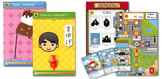
「びょんびょんどりる」 「わくわくとらべる」

デジタルならではの楽しい演出満載のドリルに、ドリルで貯めたポイント(びょん)で遊べる世界旅行ゲームをプラス!毎日の学習がもっと楽しく、もっと続く本格デジタル教材アプリです。