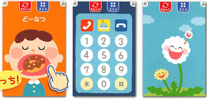
「たべものもぐもぐ」 「ケータイびぼば」 「わたげふわふわ」

「おくちあーん。タッチでもぐもぐ!」「ケータイごっこ。タッチでピポパッ!」など、タッチするだけでイラストや音などが楽しく変化する感覚遊びアプリです。