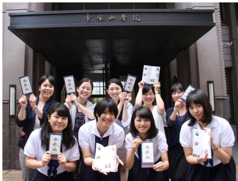
「帝塚山 WALKING MAP」を共同作成した帝塚山学院高等学校の生徒（前段）と南海電鉄若手社員ら

※1竹鶴政孝は、NHKの連続テレビ小説「マッサン」の主人公モデルとなっています。