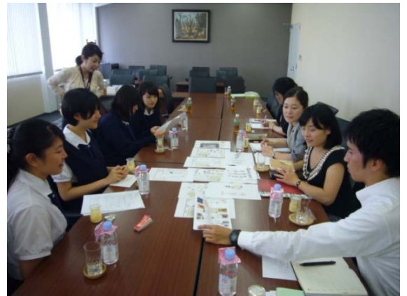
デザイン検討会の様子