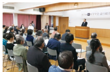
帝塚山派文学学会設立総会

帝塚山学院創立100周年にあたる今年、記念行事の一環として帝塚山派文学学会主催による記念文化講演会を下記の通り開催します。